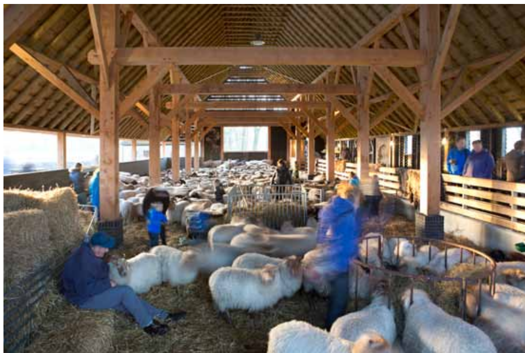
De nieuwe schaapskooi, DAAD architecten